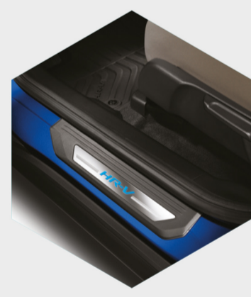
Adorno de piso para puerta con luz