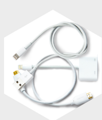
Kit de conexión HondaLink™