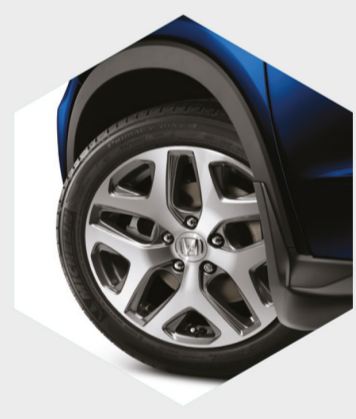
Rin 17" / Guardafangos