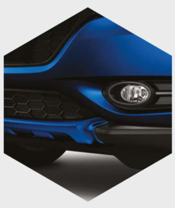
Faros de niebla