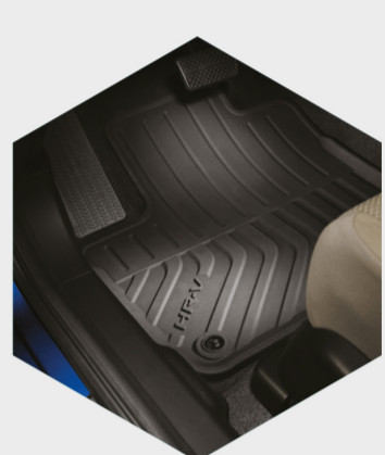
Tapetes toda temporada