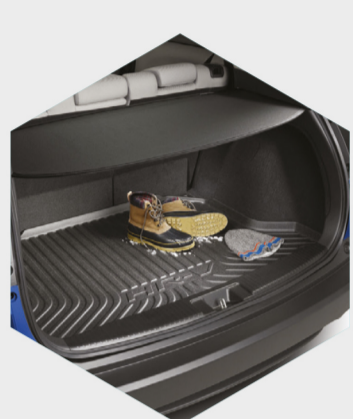
Cubierta de carga