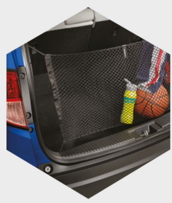
Red de carga