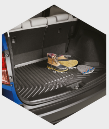
Bandeja de carga