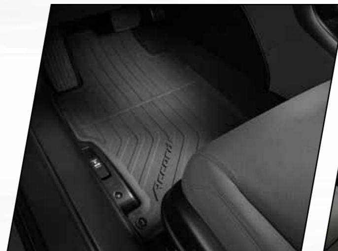
Tapetes toda temporada