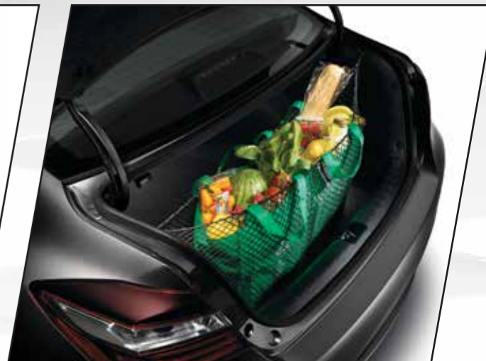
Red de carga