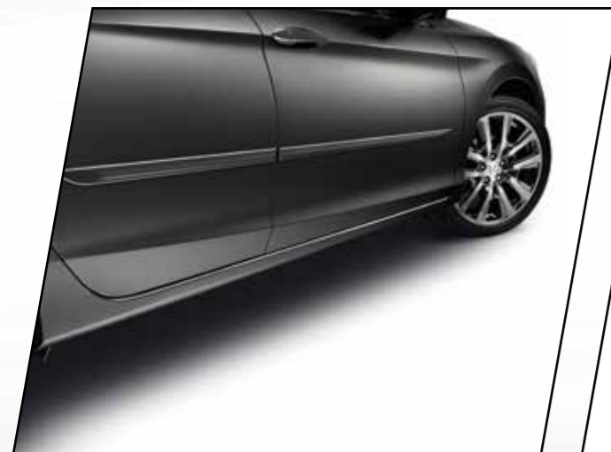
Molduras protectoras laterales