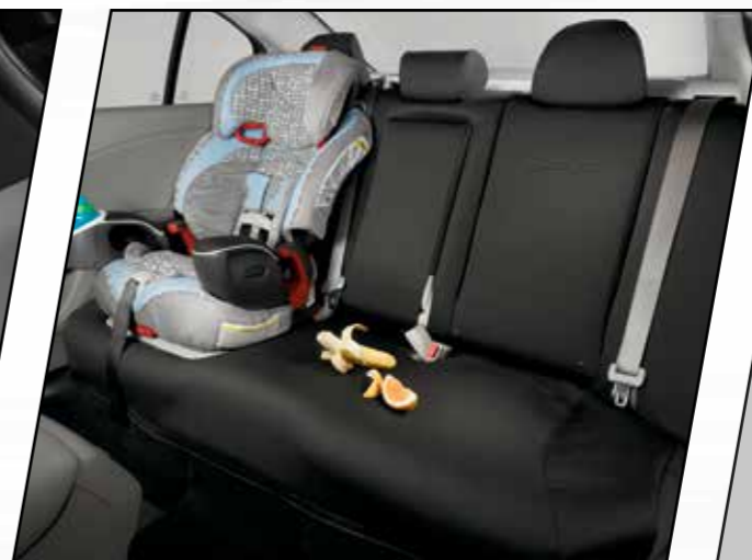
Cubierta protectora 2da. fila