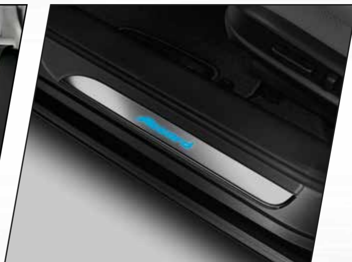
Adorno de piso para puerta con luz