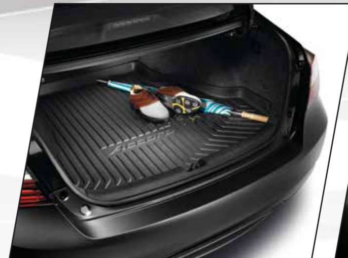
Bandeja de carga